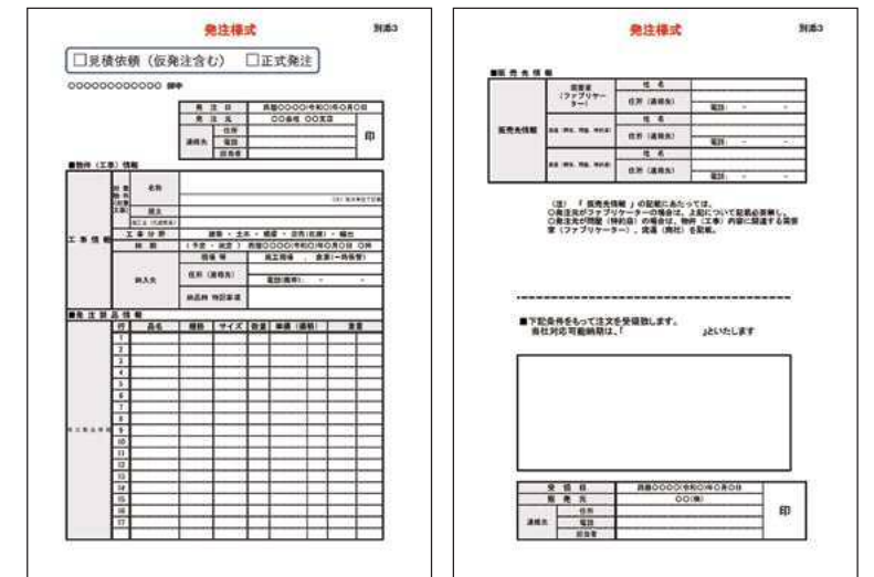
発注様式によって納期・納入先が明確な注文から優先的に供給できる環境を整備する

これによって、先行発注、水増し発注、重複発注など実需に基づかない発注は抑制されるはずですが、発注様式が一度にすべて切り替わるのは現実的には難しいと思いますが、関係者に尋ねると徐々に切り替わりつつあるようです。